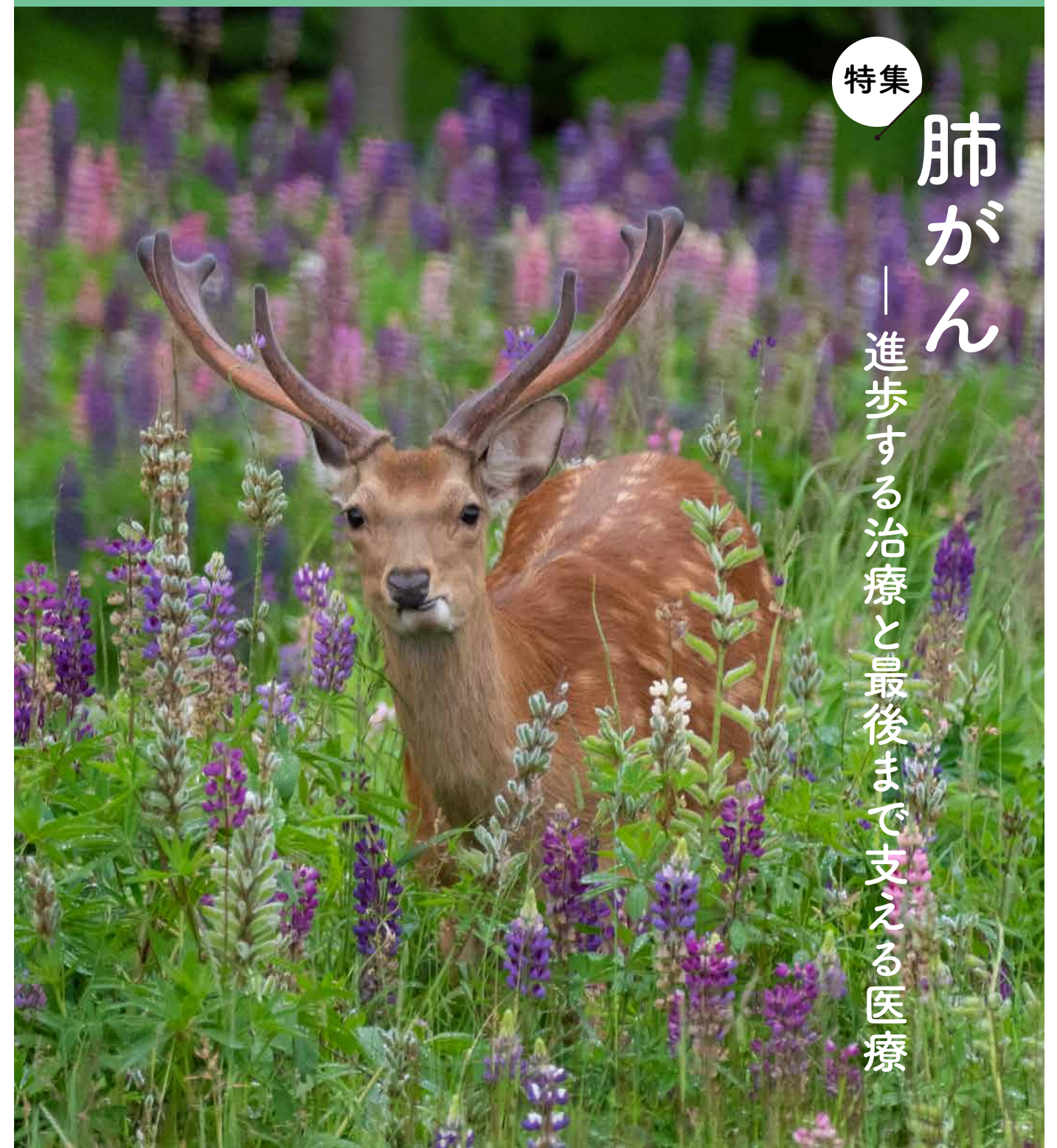
表紙写真：エゾシカとルピナス