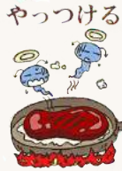
食品を十分に加熱

常は症状が1〜3日続いた後、 治癒します。 ノロウイルスには有効なワクチンも特 効薬も無く対症療法に限られています。 特に下痢・嘔吐による脱水症状に注意が 必要で、重症化の原因になります。 こまめな水分補給を行い脱水症状予防を しましょう。