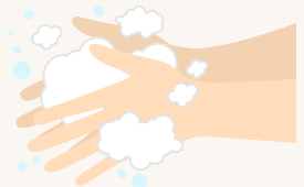
石鹸と流水での手洗い