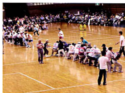
皆さん気合入ってます！！