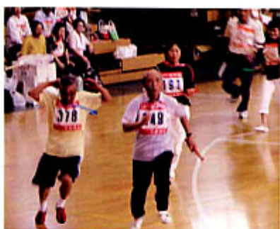
全力疾走！力強いですね。