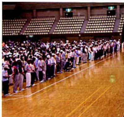
大盛り上がりの会場！！