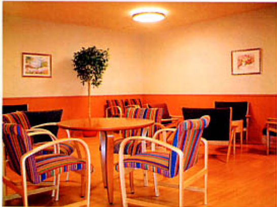
ゆとりと開放感あるラウンジ

当院では最新の機器を使用し、治療中（約4時間）にTVやDVDを鑑賞したり、落ち着ける音楽などを流して、患者様ができるだけ快適に過ごせるよう努力してまいります。