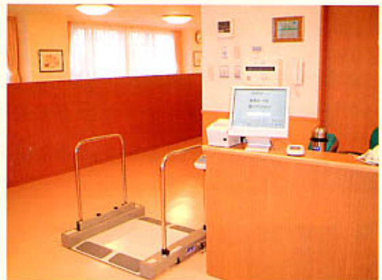
車椅子の方にも対応できるシステム