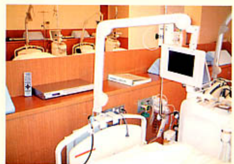
透析中TV、DVD鑑賞もできます