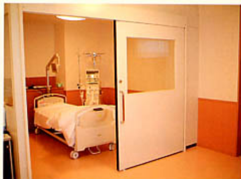
感染症から守る除菌室