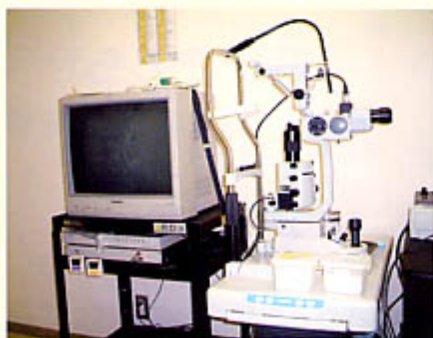
最新の検査装置を導入

当院に眼科が新設 されました。目の検 査はもちろん眼鏡や コンタクトの処方や 糖尿病などで眼が悪 くなった方など、あ らゆるケースの患者 様に応じていきま す。最新の検査装置 を導入して、できる 限り早期発見、早期治療を目指していきま すのでよろしくお願ひします。 尚、診療時間は毎週木曜日の 午前8時30分～12時までです。