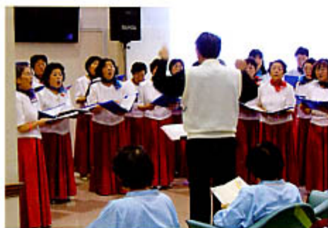
12月11日（土）フレアデスによるコンサート

吉田病院ロビーにて、合唱団フレアデスによるクリスマスコンサートが行われました。とても美しいハーモニーでロビーにいる事を忘れてしまうようなひと時でした。