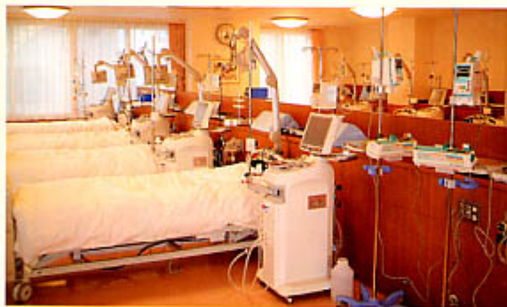
やさしい光に包まれた透析室