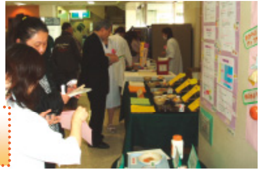
試食コーナーでは《柿のようかん(左)》《おからのカップケーキ(右上)》《アップルポテト(右下)》がふるまわれました♪