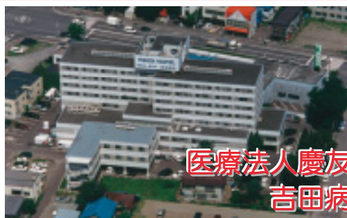
医療法人慶友会 吉田病院

内科・循環器科・呼吸器科・消化器科・外科・整形外科 歯科・口腔外科・リハビリテーション科・放射線科・眼科 月・木 8:30～19:00 火・水・金 8:30～18:00 土・日 8:30～13:00