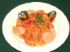
トマトスパゲティ