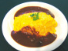
デミグラスソース