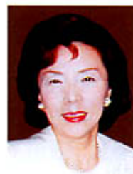
友会の目標は、「医療の質の向上」と「経営の健全化」です。

「医療の質の向上」のために、診療の質、業務の質、社会的な質などあらゆる質を総合的に管理、向上すべき努力をして参りました。医療法人全国初のISO9001審査登録、ISO14001も合わせたダブル登録や、病院機能評価の認定、人間ドック一泊優良施設の認定など、外部第三者機関の審査・指摘を受けながらマネジメントシステムを構築し、改善活動を続けつつ進んできております。お陰様で、組織の大きな枠組みができてきたと感じました。しかし、まだまだ皆様にご迷惑をおかけしている点はない点は沢山あります。これからは今まで通りの「健康・医療・福祉の原点である「まごころ」を土台とし、組織の一つ一つの働き、事柄の細部にわたってしっかりとした意志、ここを込めた活動を再確認していきたいと考えております。