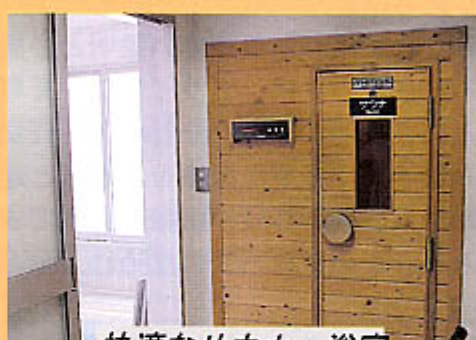
快適なサウナ・浴室

人間ドックでは、皆様が普段気になされている病気から自己症状の現れにくい病気まで様々な検査を致します。期間は日帰りから2泊3日までと時間をより多く頂ければより精密な検査を実施致します。検査項目は、癌、血液、消化器、心臓、肝臓、腎臓、膵臓、眼底、糖尿病、更にオプションで骨密度や最近注目されている乳がん検診などを最新のマンモグラフィー装置を使用して実施しています。金額は日帰りで37,000円～となっておりますのでぜひご利用下さい。