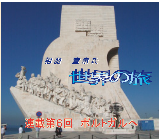
連載第6回 ポルトガルへ

大航海時代の栄華を伝える歴史を物語る数多くの遺跡や建築物を見て回ったが、ユーラシア大陸最西端のロカ岬に立った時は感激した。リスボンは山坂が多く、狭い道路で混雑する中を名物の可愛い電車も歩行者や自家用車と一緒に走っているが、ドライバーのマナーの良さには感心した。