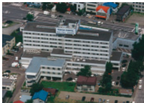
医療法人慶友会 吉田病院

内科・循環器科・呼吸器科・消化器科・外科・整形外科 歯科・口腔外科・リハビリテーション科・放射線科・眼科