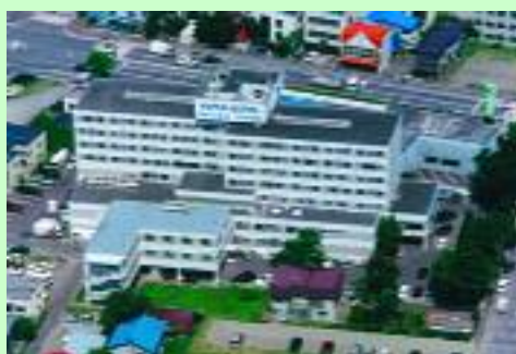
医療法人慶友会 吉田病院

※ 4月よりシフト変更の予定ですので、受付等でご確認下さい ※ また、4月より整形外来は月～金の診療となる予定です