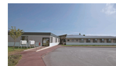
グループホーム K館