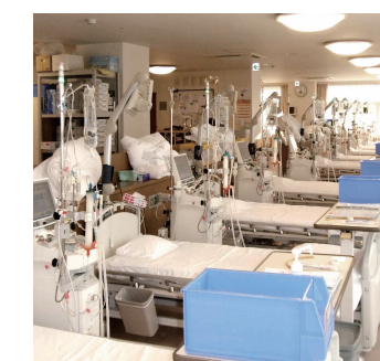
人工腎臓センター