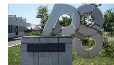
デイサービスセンター ほたる