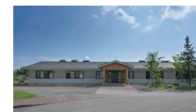
グループホームアテナ