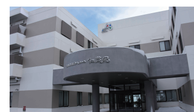
特別養護老人ホーム 仁慈苑