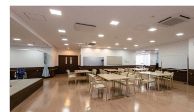
デイサービスセンター 透空