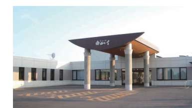
特別養護老人ホーム 養生の杜カムイ

また、グループホームでは季節行事など地域との関りを積極的に作り、人と人とのふれあいを大切にす一方、一人ひとりの個性とプライバシーを尊重し、安心のサービスを心掛けています。