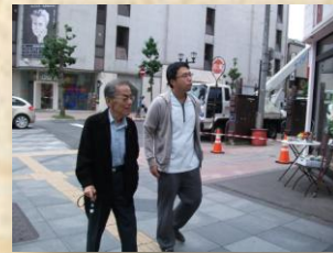
久しぶりの買物公園の風景を楽しみながら400mほど歩きました。

今回の個別レクでは買物公園の宮越屋珈琲店へ行って歩行状態の確認しおいしいコーヒーをいただきました。