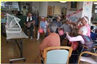
玉入れは皆さん身を乗り出して玉を投げていました(^)

毎年恒例のさくら館運動会を今年も開催しました！玉入れ、借り物競争、スリッパ飛ばし、ボール送り競争を行い、いつも以上に皆さんで身体を動かすことが出来ました♪