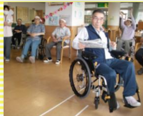
カードに書かれた新聞を持ってゴール！