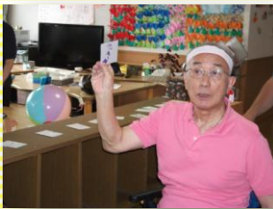
借り物競争ではカードに書かれた物を持ってゴールを目指します☆