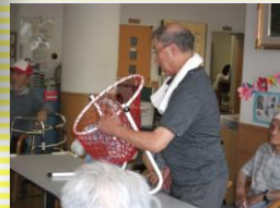
玉出しのお手伝いも・・・