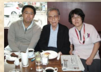
外出する事で気分転換にもなりました。評価結果は今後のリハビリへ活かしていきます。