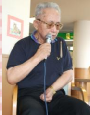
あかたれを歌って 下さいました☆