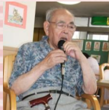
素敵な津軽平野でした♪

カラオケ大会では 11 人もの利用者様が歌声を披露して下さいました☆他の利用者様も応援して下さいみなさんで楽しむことができました♪