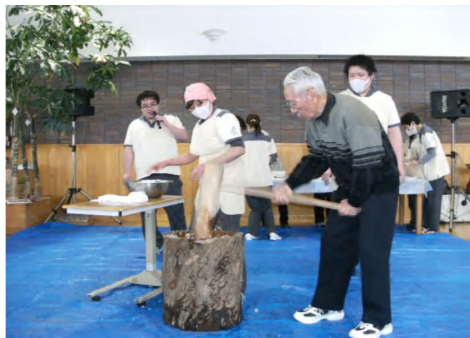
・もちつき (12月28日に実施)

職員のダンスはいかがでしたか? 昨年とは衣装を替えて制服で踊りましたよ。一緒に踊って下さる方もいて大変盛り上がりましたね。日本舞踊も風情があって素敵でしたね。年末には餅つきもしましたよ。